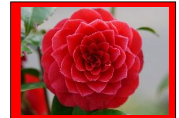
Die Rose des Winters