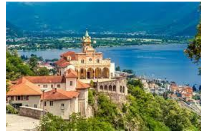
Wallfahrtort Madonna del Sasso am Lago Maggiore